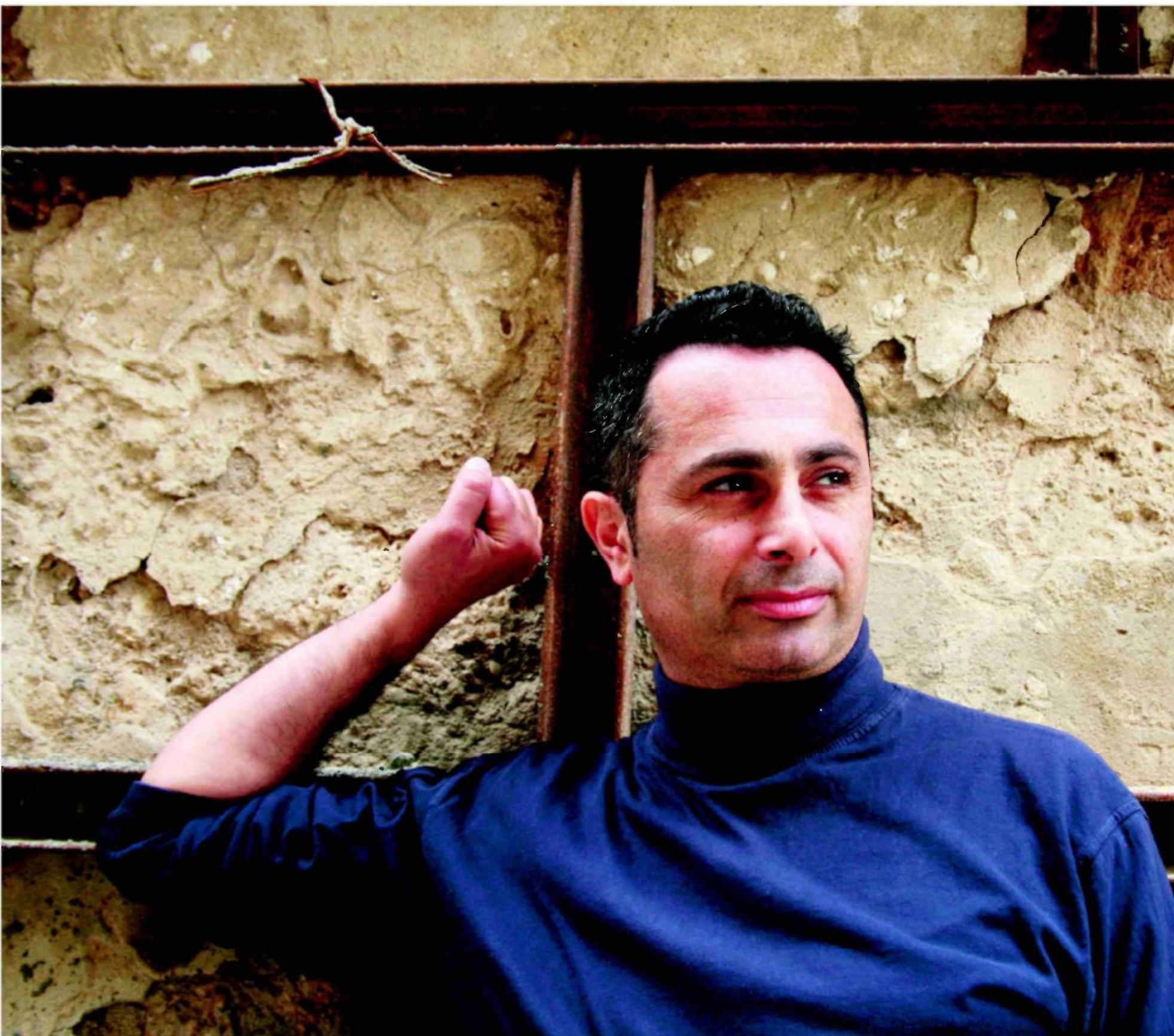
"לא שכחתי אותו". עבאדי